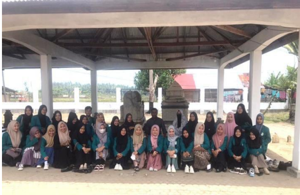
Gambar 4. Dosen dan Mahasiswa ziarah ke Makam

dipahat secara lengkap. Kaligrafi ini tidak hanya berfungsi sebagai penghias, tetapi juga memiliki makna spiritual, menggambarkan harapan akan keselamatan dan kedamaian bagi almarhumah di alam baka. Ayat Kursi yang termaktub dalam Surah Al Baqarah serta Surah Ali Imran ayat 18 dan 19 turut menghiasi nisan ini, memperkuat nuansa religius dan menambah nilai kesakralan makam tersebut [(Jassin, 1991). Nisan Ratu Nahrasiyah tidak hanya menjadi saksi bisu atas kejayaan masa lalu, tetapi juga sebagai warisan budaya yang memperlihatkan hubungan antara seni, agama, dan sejarah dalam peradaban Islam di Asia Tenggara.