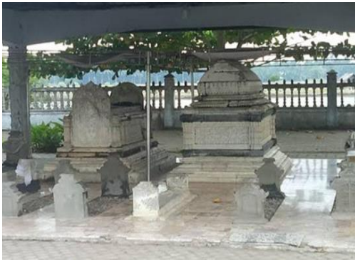
Gambar 1. Makam Ratu Nahrasiyah

bermasyarakat. Salah satu aspek yang menarik perhatian adalah batu nisan Sultanah Nahrasiyah, yang dihiasi dengan aksara Kufi. Aksara ini merupakan jenis kaligrafi Arab tertua yang berasal dari Kufah, dan pada batu nisan tersebut ditemukan inskripsi dalam bahasa Arab dan Melayu Kuno. Keunikan aksara Kufi yang megah pada batu nisan ini tidak hanya menjadi bukti nyata kebesaran sejarah Islam di Aceh, tetapi juga menggambarkan kekayaan warisan budaya yang diwariskan oleh Sultanah Nahrasiyah. Inskripsi pada batu nisan ini menjadi salah satu aspek penting yang menyoroti kemajuan intelektual dan budaya yang terjadi pada masa pemerintahan Sultanah Nahrasiyah. Eksplorasi sejarah ini memberikan kesempatan untuk memahami nilai-nilai kepemimpinan dan keilmuan yang terkandung dalam peninggalan tersebut, sekaligus menegaskan pentingnya pelestarian warisan budaya ini bagi generasi masa kini dan mendatang.