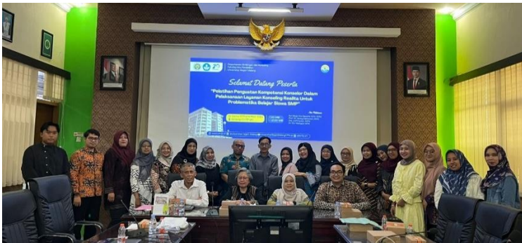
Gambar 5. Kegiatan pelatihan layanan dalam meningkatkan kemampuan konselor untuk layanan konseling realita