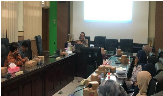
Gambar 1. Pemaparan Sesi 1 oleh narasumber

implementasi konseling realita terhadap permasalahan belajar siswa.