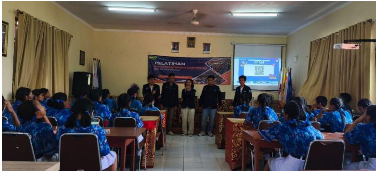
Gambar 2. Kegiatan Sosialisasi Literasi Digital di SMP Negeri 9 Denpasar

Kegiatan pengabdian kepada masyarakat dilaksanakan di SMP Negeri 9 Denpasar pada periode September–Desember 2025 dengan melibatkan 34 siswa sebagai peserta sosialisasi literasi digital. Peserta dipilih secara purposive melalui koordinasi dengan pihak sekolah, mencakup perwakilan siswa aktif dalam organisasi sekolah serta siswa dari kelas reguler. Pada tahap evaluasi, satu siswa mengalami kendala jaringan saat mengakses kuis digital sehingga analisis dilakukan terhadap 33 respons yang dinyatakan valid. Pelaksanaan kegiatan sosialisasi kepada siswa ditunjukkan pada Gambar 2.