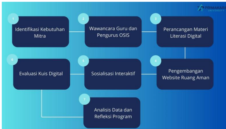
Gambar 3. Alur Pelaksanaan Program Pengabdian Literasi Digital