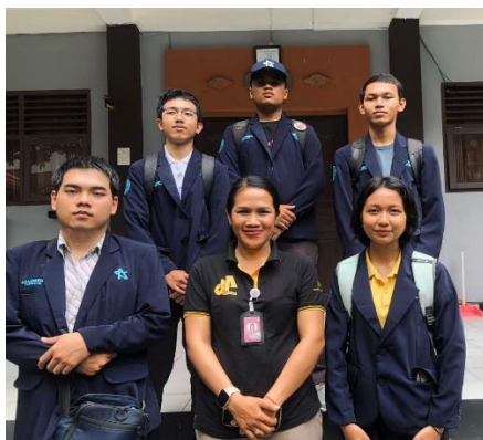
Gambar 1. Wawancara awal dengan guru dan pengurus OSIS SMP Negeri 9 Denpasar

Sebagai bagian dari upaya memahami kondisi mitra, studi pendahuluan dilakukan di SMP Negeri 9 Denpasar melalui wawancara eksploratif dengan satu orang guru serta lima pengurus OSIS sebagai representasi siswa. Hasil wawancara mengungkapkan bahwa sebagian besar siswa aktif menggunakan media sosial untuk komunikasi sehari-hari dan berbagi konten digital. Namun, sekolah belum memiliki kanal pengaduan berbasis digital yang secara khusus menangani laporan cyberbullying , dan mekanisme pelaporan masih dilakukan secara langsung kepada guru sehingga berpotensi menimbulkan rasa sungkan bagi siswa dalam menyampaikan pengalaman mereka. Kondisi tersebut mencerminkan kesenjangan antara tingginya aktivitas digital siswa dan keterbatasan sistem perlindungan digital di lingkungan sekolah. Atas dasar itu, kegiatan pengabdian ini bertujuan meningkatkan pemahaman siswa mengenai literasi digital dan etika bermedia sosial melalui sosialisasi interaktif, sekaligus mengembangkan platform digital sederhana berupa website edukasi yang dilengkapi kanal pengaduan berbasis WhatsApp , sehingga diharapkan tercipta lingkungan sekolah yang lebih aman dan mendorong perilaku digital yang bertanggung jawab di kalangan siswa.